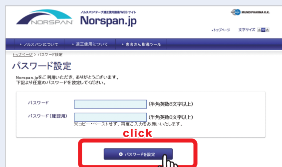
パスワード設定画面