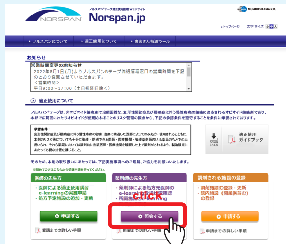
Norspan.jp 適正使用トップページ